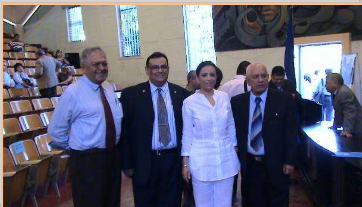
Primer Encuentro de Egresados y Docentes de los Estudios de Postgrado